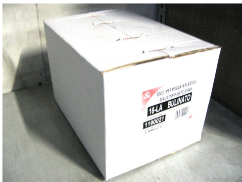
DIMENSIONI 30,5 X 22,5 X 20,5 Cm

Sigillo metallico stampato con materiale trattato anti usura per una maggior resistenza agli agenti atmosferici. I sigilli sono forniti in finitura BULINATA con profondità di bulinatura di 0,5 mm. e con trattamento superficiale di zincopassivatura