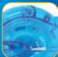
Indicatore di livello del nastro (sul retro)