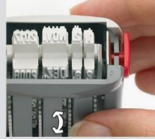
Justieren des Datumsbandes auf die Höhe der Textplatte