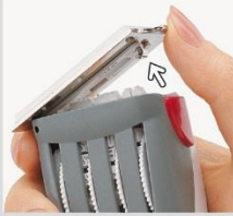
Einstellen des Datum